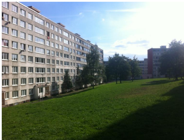
Místo odstraněné lavičky, Duchcov. Místo bývalého dětského hřiště, Janov.