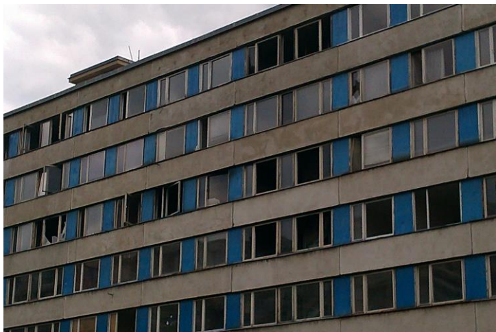
Zazděné/opuštěné byty v Janově.

VÍCE VIZ: Kapitola V. Dopady politik nulové tolerance