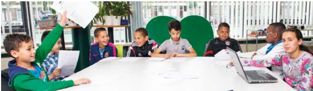
Studentská rada okresu BoTu 2016