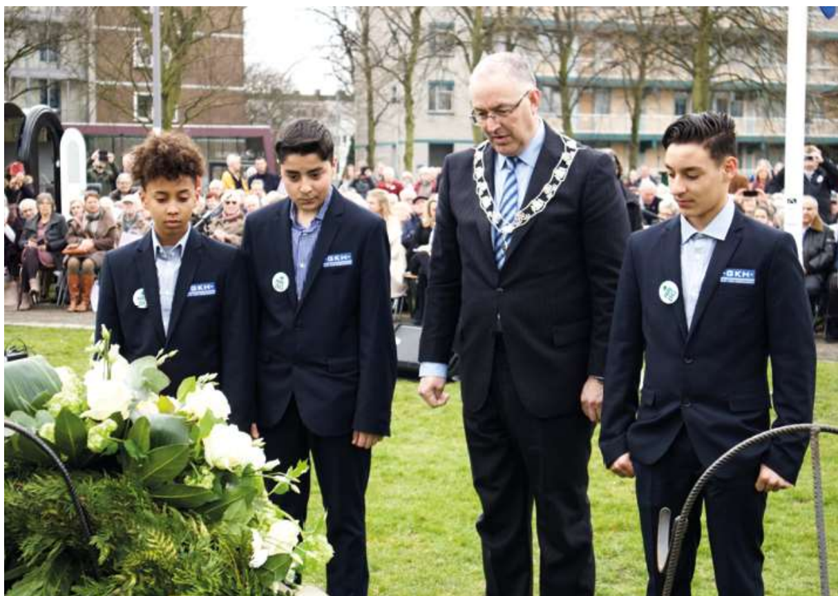
75 letá připomínka „zapomenutého bombardování“

Obnova města začala v 70. letech 20. století se zaměřením na výstavbu sociálního bydlení. Díky kombinaci levného bydlení a dostupnosti nekvalifikované práce v přístavu zapustily v BoTu kořeny různé skupiny migrujících pracovníků. Tito migrující pracovníci a jejich potomci vysvětlují dnešní různorodou demografickou situaci v této místní části.