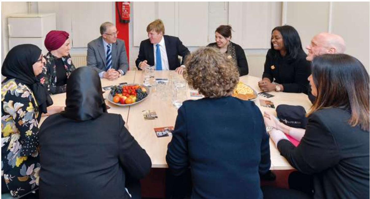
Matky v rozhovoru s králem Willem-Alexanderem a starostou Aboutalebem

Čisté a bezpečné prostředí je základním požadavkem odolné čtvrti. Index bezpečnosti pro Bospolder i Tussendijken v posledních dvou letech výrazně vzrostly. Oba okresy se pomalu posouvají k rotterdamskému průměru. Ale ještě tam nejsme, navzdory velkému pokroku v boji proti krádežím a vloupání. Obyvatelé jsou stále pravidelně znepokojeni vážnými násilnými incidenty. Tyto incidenty často souvisejí s drogami nebo jinými trestnými činy narušujícími sousedské soužití. BoTu je v koaliční smlouvě starosty a radních výslovně jmenován jako jeden celek městských obvodů, které získají cílenou bezpečnostní strategii. Strategie na snížení trestných činů narušujících soužití již přinesla dobré výsledky na Mathenesserweg a bude rozšířena na Schiedamseweg a Vierambachtsstraat.