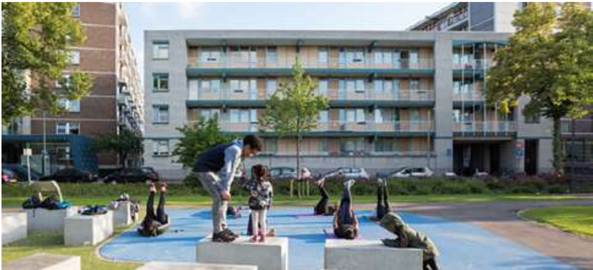
Park 1943 and the Gijsingflats

Existuje prostor pro zahuštění na různých místech v srdci BoTu, například prostřednictvím nové výstavby na náměstí Visserijplein a možné renovace budovy na Taandersstraat 121 (kde se nachází Zelfregiehuis). Úkolem není plně alokovat omezený prostor ve čtvrti k bydlení, ale vyhradit dostatečný prostor pro rozšíření občanské vybavenosti. Pier 80 jako Huis van de Buurt (Neighbourhood House) je již centrálním místem ve čtvrti, kde se lidé mohou setkávat a komunikovat, a poskytuje služby pro mladé lidi, zdravotní péči, pohodu a sport.