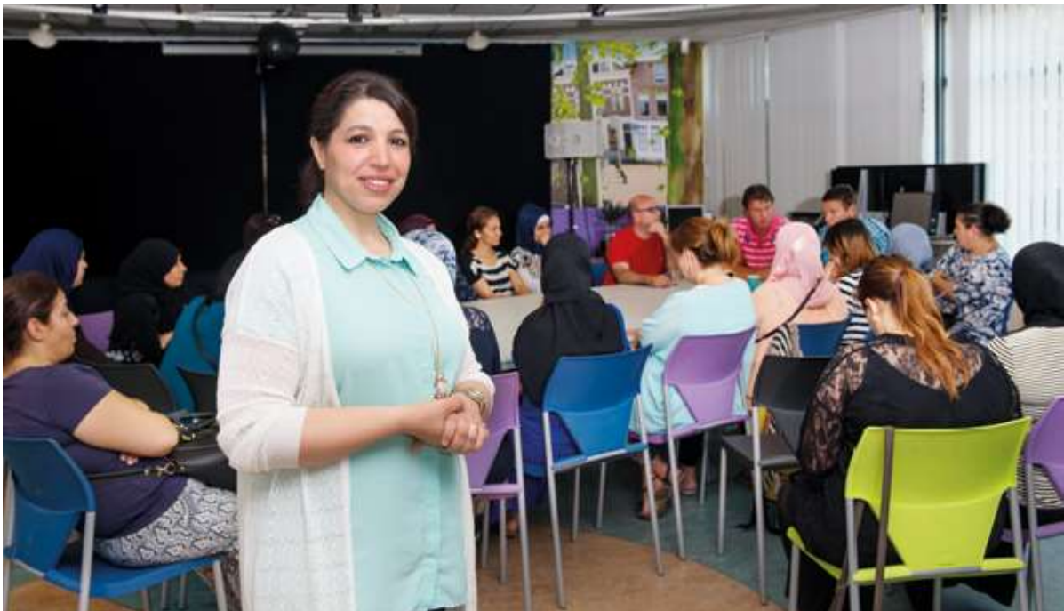
Úřednice pro rodičovské vztahy, škola Valentijn

Mezi obyvateli a zařízeními v BoTu je velká propast. Abychom tuto propast překonali, potřebujeme flexibilní a vnímavé veřejné orgány a odolné profesionály. Jsou to profesionálové, kteří úzce spolupracují s obyvateli, klíčovými osobnostmi a neformálními sítěmi v okrese. Odolní profesionálové vědí, co se děje ve čtvrti, pracují pro obyvatele i s nimi a mají svobodu poskytovat řešení na míru.