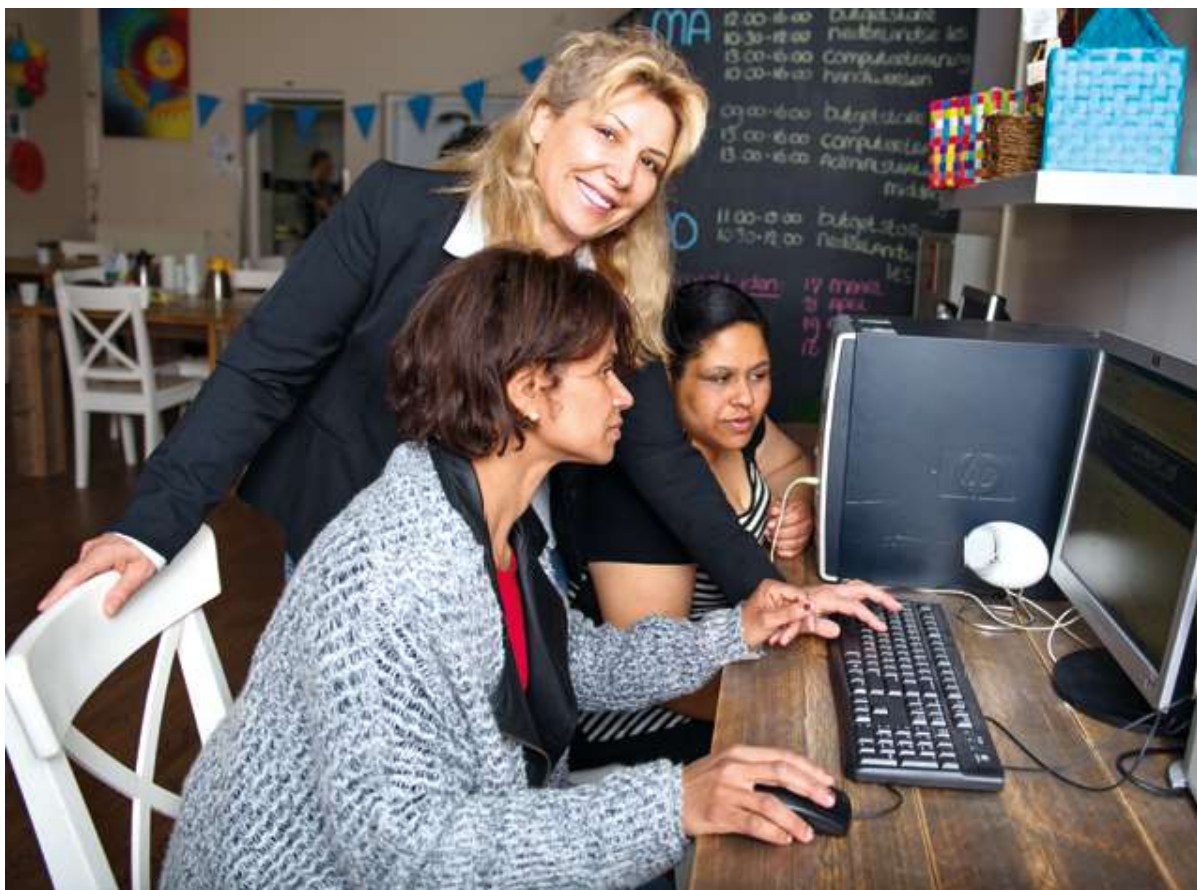
Počítačový kurz pro obyvatele