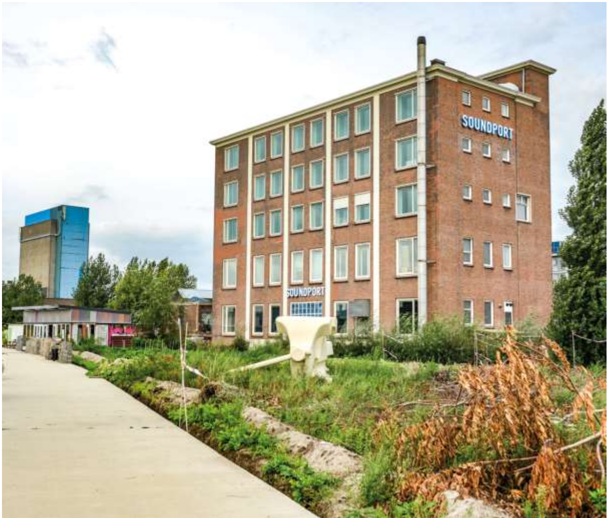
Vierhavenblok s Keilepandem, Keilewerfem a Voedseltuinem, jedním z tvůrců prostorů v M4H