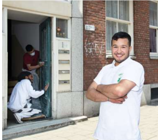
vysoká škola v Delfshavenu