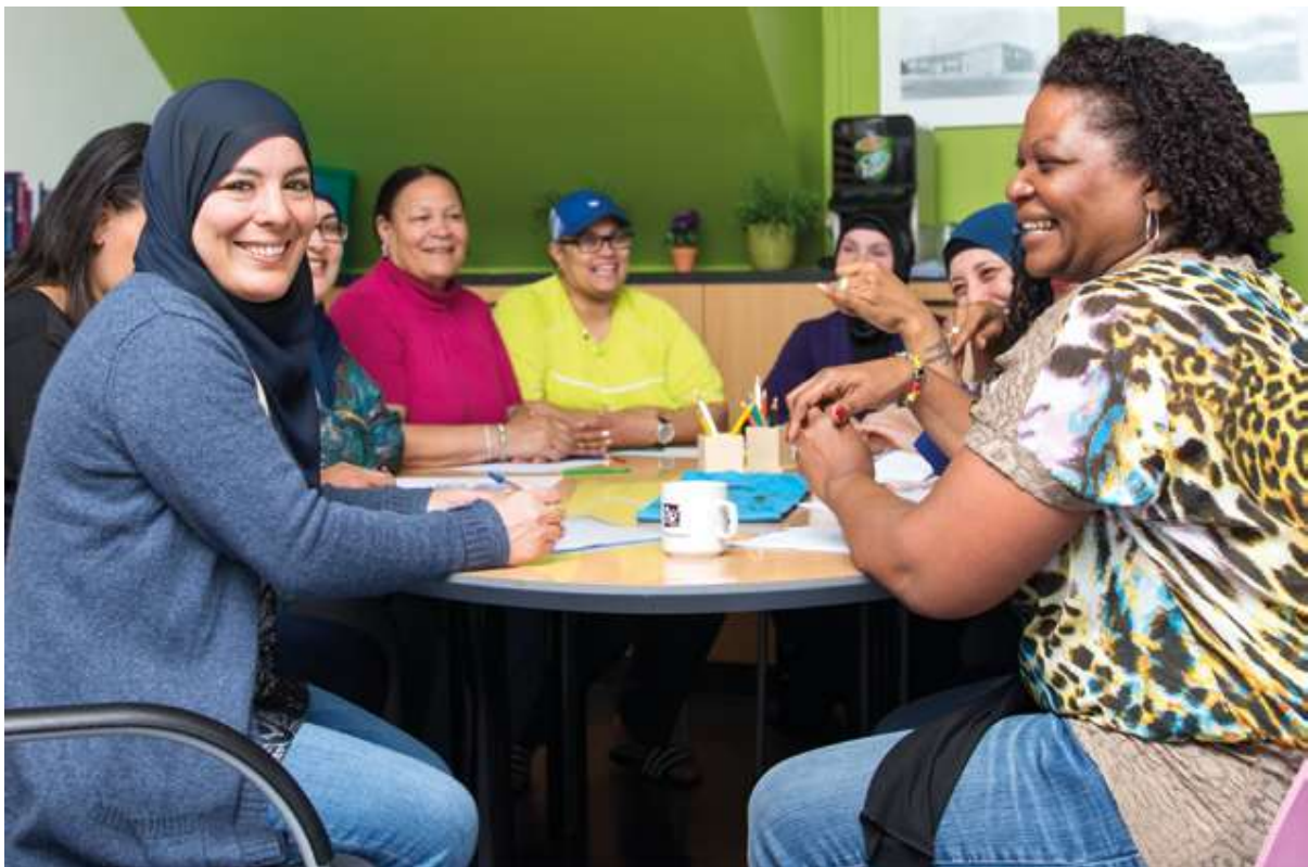
Rodičovský pokoj ve škole Nicolaas

Aktivní vlastnictví a zapojení obyvatel je nezbytné pro udržitelnou odolnost okresu. V posledních letech jsme úzce spolupracovali s obyvateli, jejich sítěmi a iniciativami v různých oblastech BoTu. Budování komunity je zaměřeno na další posilování, propojování a mobilizaci místních komunit. Rozvoj okresu zevnitř a zdola nahoru se zaměřením na kapacity místo na problémy a nedostatky. Základem je metoda Asset-Based Community Development (ABCD). Budovatelé komunity jdou do čtvrti bez agendy a – pod vedením družstva Delfshaven – vyhledávají talenty a navazují kontakty, aby zvýšili odolnost čtvrti.