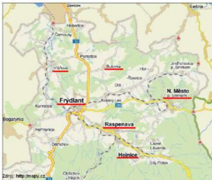
Obrázek č. 1: Mapa sociálně vyloučených lokalit (Sociofaktor, 2013)