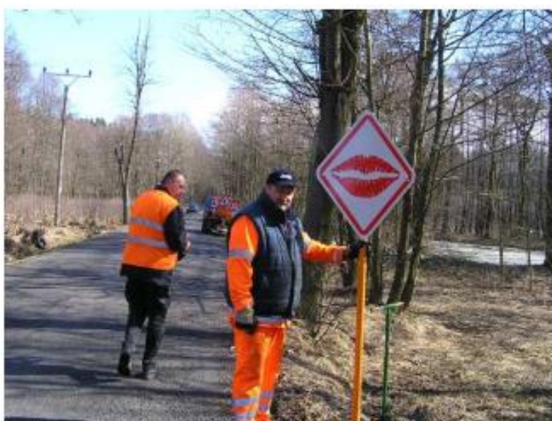
Fotografie 2: Cedule v Aši