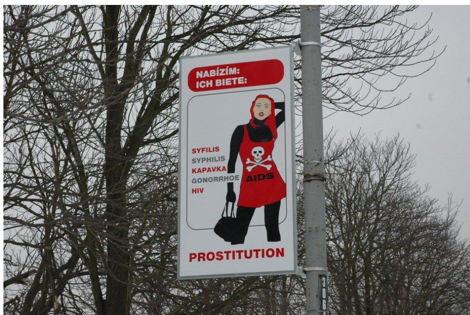
Fotografie 1: Cedule v Chomutově

Zástupci městských policíí uváděli například i umístování cedulí, které měly zákazníky upozornit na možnost výskytu pohlavně přenosných chorob. Takové cedule se objevily v Chomutově. V Aši byl naopak pomocí cedulí vymezen prostor, kde mohly být sexuální služby nabízeny.