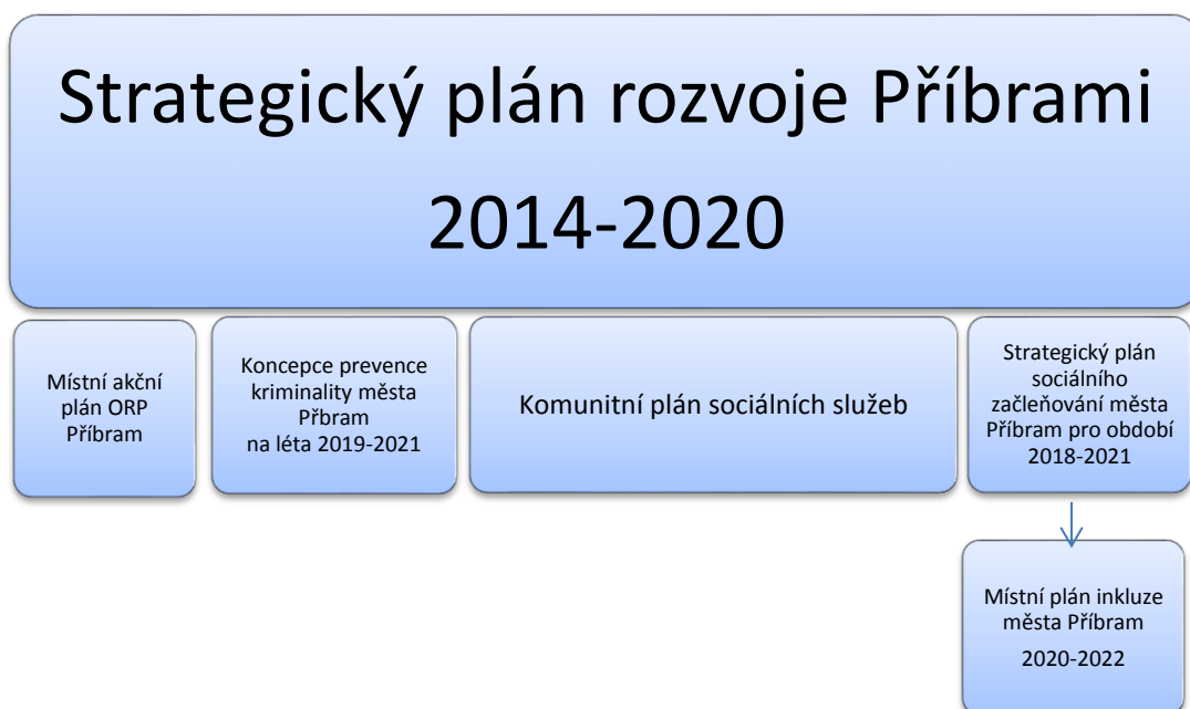
Schéma č. 1: MPI jako úzce vymezená tematická oblast rozvoje v oblasti vzdělávání na území města.

Pro zřizovatele škol v ČR, Příbram nevyjímaje, není lehké na jedné straně respektovat značnou míru faktické autonomie škol a na druhé straně ovlivňovat ve školách kvalitu vzdělávání s výhledem na další rozvoj obce, k čemuž ohled na otázky sociálního vyloučení neodmyslitelně patří. První pokus formulovat priority místní vzdělávací politiky představoval MPI 2019. Předkládaný navazující strategický dokument MPI 2020-2022 představuje další krok města k systémovému řešení podpory inkluzivního vzdělávání v místní vzdělávací síti.