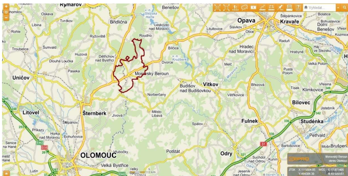
Mapa č. 1: Město Moravský Beroun

Dle SPSZ 1 je problematika sociálního vyloučení v Moravském Berouně spjata převážně s romským obyvatelstvem. V posledních letech však stále častěji kvůli zhoršené socioekonomické situaci postihuje také rodiny z majority. V současnosti je počet osob ohrožených sociálním vyloučením odhadován na cca 280. Sociální vyloučení je možné definovat jako stav, v němž se ocitají lidé, kteří mají ztížený přístup k institucím, společenským sítím, ekonomickým a kulturním statkům, a participaci na chodu většinové společnosti, na níž jsou ovšem závislí. Mezi osoby ohrožené sociálním vyloučením můžeme v současné době zahrnout nízkopříjmové rodiny s dětmi, seniory, osoby bez příštířeší, matky samoživitelky, osoby zdravotně postižené, osoby dlouhodobě nezaměstnané, etnické menšiny, osoby vracující se z výkonu trestu, osoby propuštěné z ústavních zařízení a další osoby se sníženými kompetencemi samostatně jednat.