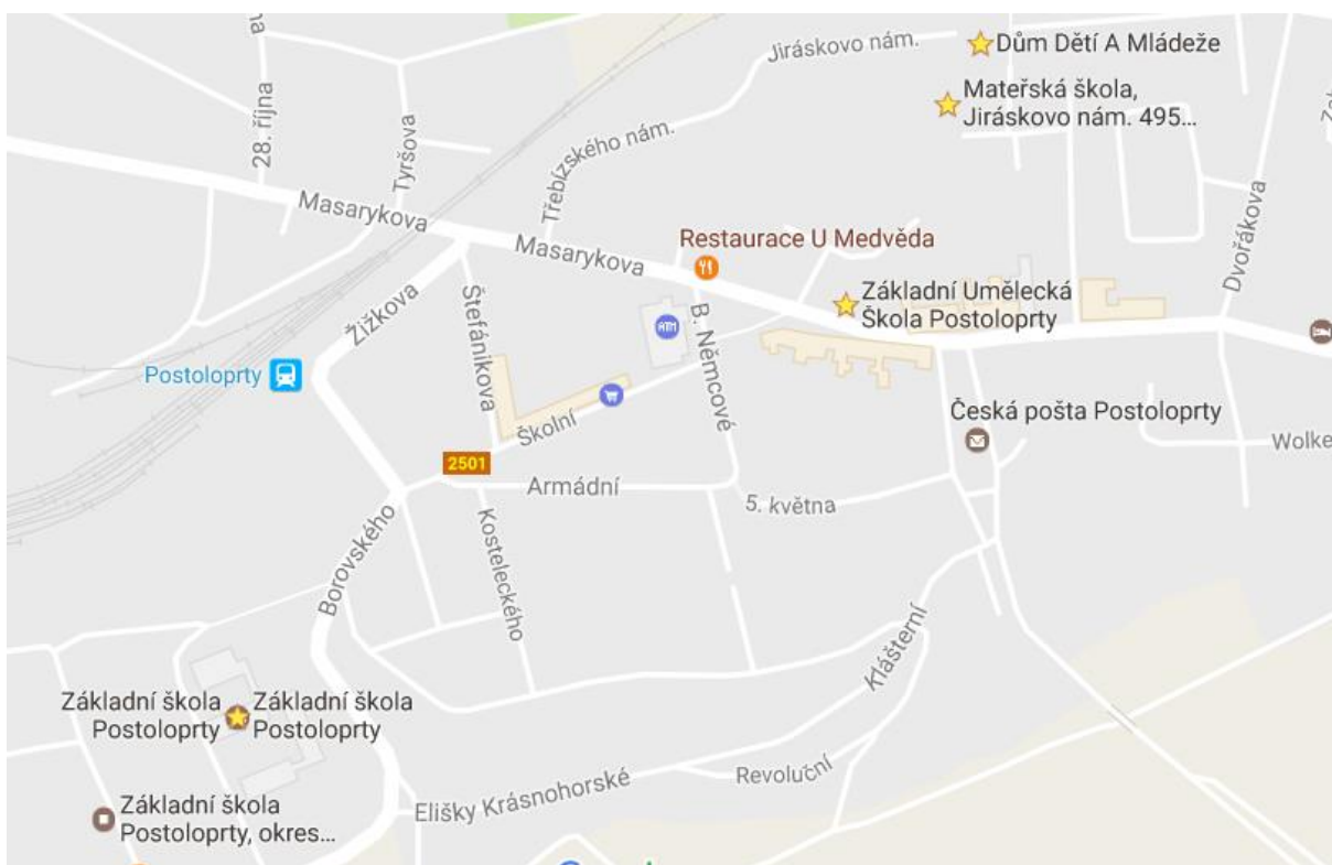
Mapa města Postoloprty se zobrazením škol a školských zařízení 2

Město Postoloprty je zřizovatelem Základní školy, Mateřské školy, Základní umělecké školy a Domu dětí a mládeže.