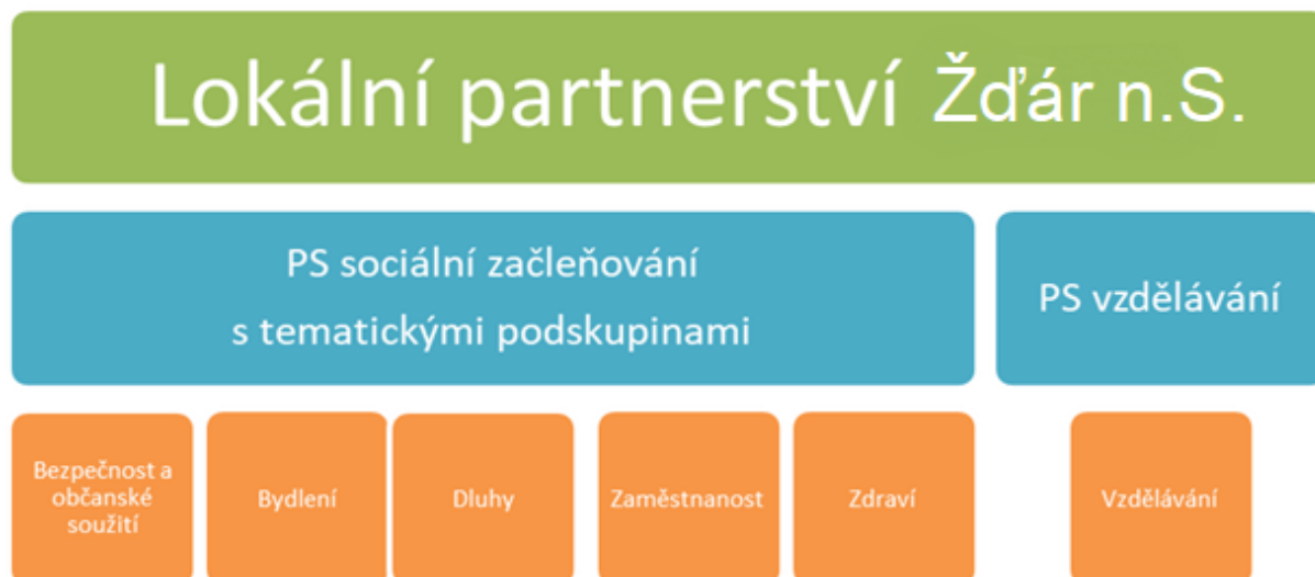
Obrázek 1 – Lokální partnerství Žďár nad Sázavou