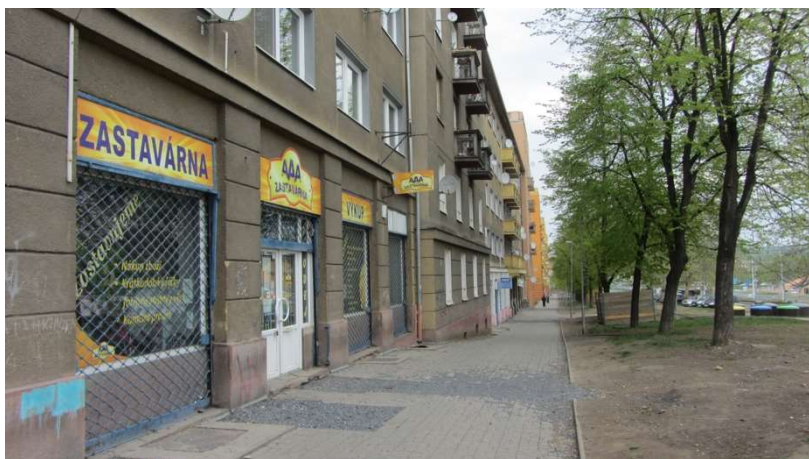
Obrázek 13 Tř. Budovatelů

Ve Stovkách a jejich okolí také zásadně chybí prostor, kde lze trávit čas uvnitř – např. restaurace, kavárna, společenské centrum nebo klub. Jediné možnosti představuje hospoda Domino (vedle stejnojmenné ubytovny) a hospoda Kubíček (Třída budovatelů 90), které jsou obě vnímány velmi negativně a nejsou příliš využívány – jedná se o nálevny se sortimentem prakticky omezeným na alkohol. Pro místa setkávání tak slouží nákupní centrum Central, příp. se lidé navštěvují doma. Obyvatelům tak citelně chybí místo, kde by se mohli setkávat, což představuje omezení jak pro společenské vyžití jednotlivců, tak pro sousedské vztahy v celé studované lokalitě.