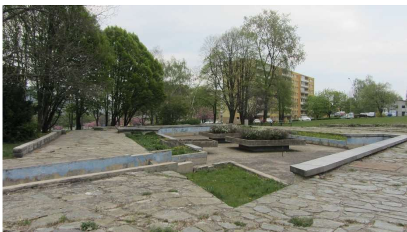
Obrázek 16 Park Střed, bazény

Uživatelé parku poukazovali na to, že v parku se kromě laviček (a soustavy vypuštěných bazénků, které jsou využívány k hrám dětí) nenachází jiné prvky, které by nabízely posezení či možnost aktivního odpočinku. Připravovaná rekonstrukce parku, která má zahrnovat i vybudování nových herních prvků, tak mezi obyvateli Stovek velmi rezonovala. Někteří z nich – zejména mladí – ji velmi vítají, protože v ní vidí příležitost lákavého sportovního vyžití v blízkém okolí svého bydliště, jiní jsou k výstavbě spíše skeptičtí a domnívají se, že herní prvky budou brzy zničeny. Obavy také panují z potenciálních sporů, které by vznikaly mezi různými skupinami obyvatel (zejména tedy mezi romskými a majoritními uživateli hřiště) v případě, že by hřiště bylo příliš frekventované a nevznikla v budoucnosti další místa, kde mohou mladí lidé trávit čas.