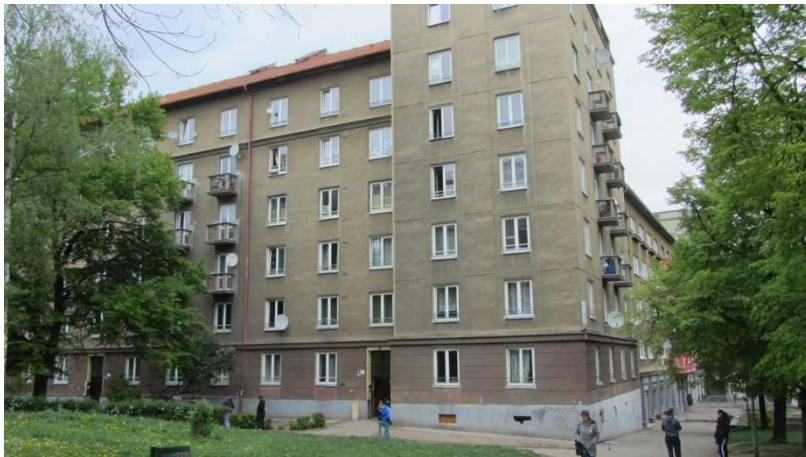
Obrázek 6 Blok 92, vchod 2360