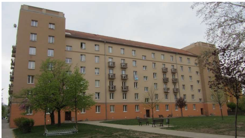
Obrázek 5 Stovky, blok 97