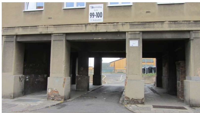
Obrázek 11 Průchod do dvora bloků 99 a 100