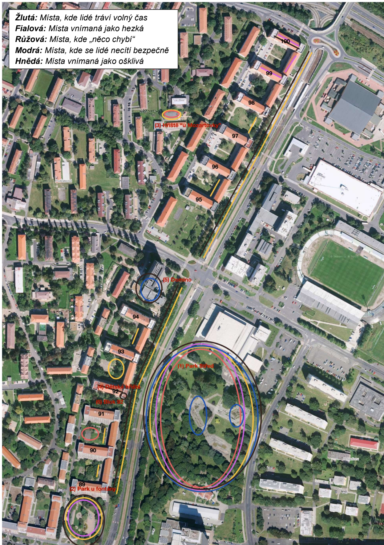
Obrázek 12 Klíčová místa ve Stovkách