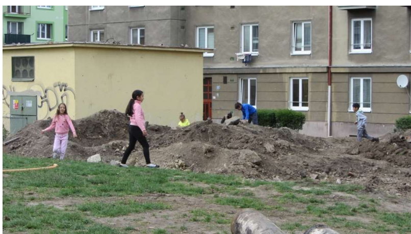
Obrázek 15 Improvizované hřiště na staveništi u Stovek