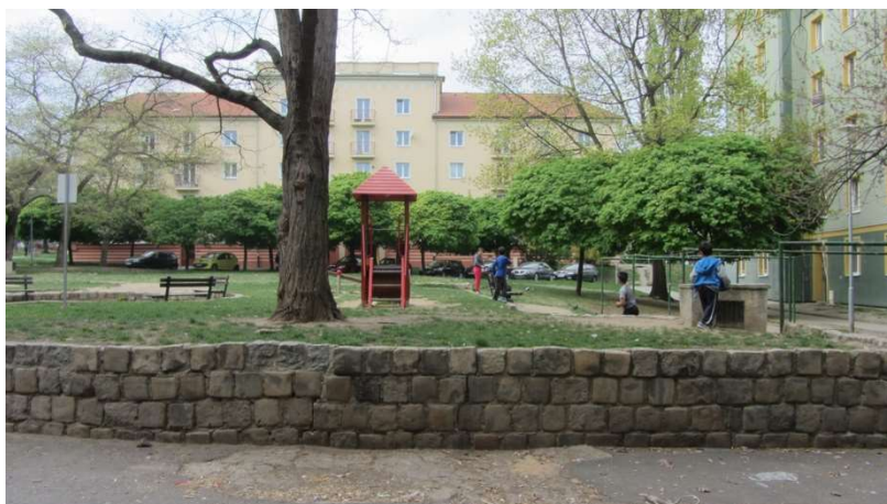
Obrázek 14 Hřiště mezi bloky 92 a 93

kamenů atd. To působí, že nedostatek hřišť a vyžití obecně vnímají problematicky nejen děti samotné a jejich rodiče, ale i ostatní obyvatelé Stovek, které improvizované hry mohou rušit či obtěžovat.