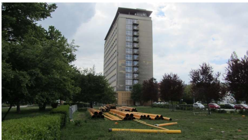
Obrázek 21 Ubytovna Domino od dolních Stovek