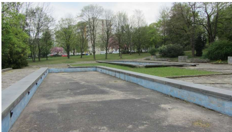
Obrázek 17 Park Střed, bazény