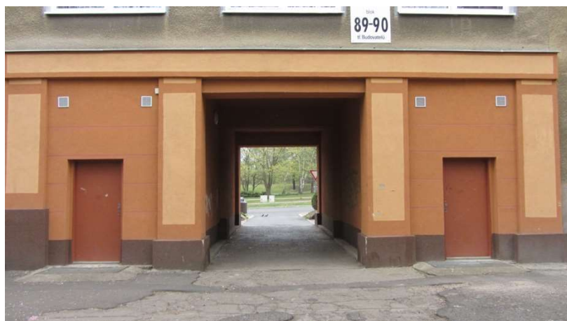
Obrázek 10 Z části zazděný průchod do dvorů bloků 89 a 90

Z hlediska využívání veřejného prostoru a jeho jednotlivých prvků byl nejvýrazněji tematizován nedostatek míst, kde lze trávit volný čas, a to jak v případě dospělých, tak dětí. Pro obyvatele Stovek je přitom charakteristické zdržování se přímo v lokalitě. To lze vysvětlit sociodemografickou strukturou obyvatel (relativně vysoký poměr dětí, které rodiče nepouští dál do města; vyšší poměr žen na mateřské či rodičovské dovolené a v domácnosti a nezaměstnaných osob, kteří nechodí do práce mimo lokalitu) a také jinými skutečnostmi, které pojmenovávali především sociální pracovníci (omezené prostředky; nižší zájem o dění ve vzdálenějším okolí).