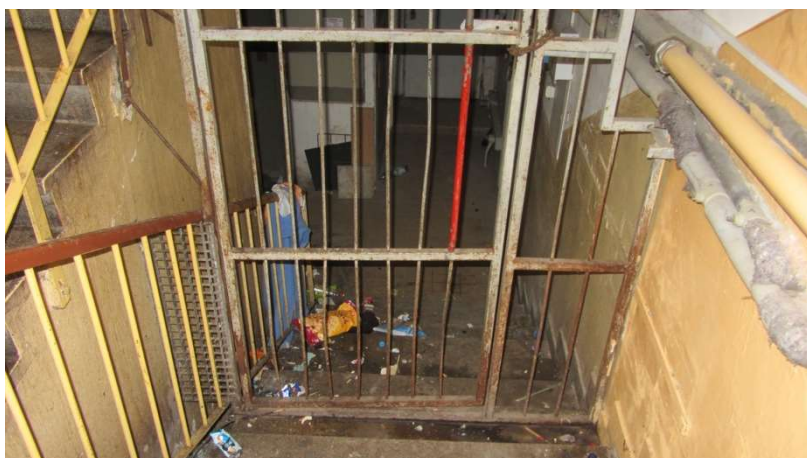
Obrázek 8 Vchod do sklepních prostor v bloku 92, na schodech lze vidět injekční stříkačku

K aplikaci drog dochází zejména na nepříliš viditelném místě mezi hospodou Domino a trafostanicí („za Viktorem“) a ve vchodu 2360 bloku 92 (na chodbě a na podestě v nejvyšším patře) a dále. Na těchto místech se injekční stříkačky nacházely i v době pozorování. V této části domu podle respondentů docházelo v minulosti i k prodeji pervitinu, informaci však nebylo možné ověřit. K injekční aplikaci pervitinu dochází v menší míře i v parku Střed (v křoví, v bazénkách), prostor je tam však příliš otevřený a veřejný a uživatelé tam zpravidla netráví čas. Už samotná existence uživatelů je vnímána jako ohrožující a jejich domnělá či reálná přítomnost na určitých místech v lokalitě představuje zásadní faktor (ne)využívání daného prostoru.