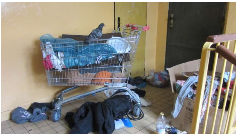
Obrázek 3 Poslední patro v bloku 92 ve vchodě 2360

Byť hluk a nepořádek bezpochyby souvisí se způsobem využívání volného času, jsou zásadně podmíněny především urbanistickým řešením sídliště a koncentrací obyvatel na relativně malém prostoru. Podle informací uvedených ve Vstupní analýze bylo ve Stovkách v roce 2015 evidováno 2933 obyvatel, kteří žili odhadem v 977 domácnostech. Lokalita se rozkládá na ploše cca 1 km x 130 m, a hustota obyvatel je tak velmi vysoká. Mimo to je ve srovnání s městem Most celkově v lokalitě vyšší počet dětí, což přispívá k celkové hlučnosti, a dále i osob, které z různých důvodů ve všední dny neodcházejí do práce (péče o děti, nezaměstnanost) a tráví čas doma či v jeho okolí. V prostorech dvorků, které jsou ze tří stran obklopeny jednotlivými částmi bloků a ze čtvrté strany domem přes ulici (K. Biebla nebo W. A. Mozarta), jde navíc jakýkoliv zvuk přímo do oken obyvatel a je obtížné ho eliminovat. Část respondentů uvádí, že přestože byla z lokality odstraněna většina laviček, na kterých trávili čas hluční obyvatelé, k rušení dochází i nadále. Ani samotní respondenti, kteří tráví čas venku (mladí lidé, matky s dětmi) a jejich chování tedy bývá předmětem nespokojenosti sousedů, neuvádějí, že by po odstranění míst k sezení či ke hrám změnili působiště – pouze jsou s možností využití prostoru méně spokojeni.