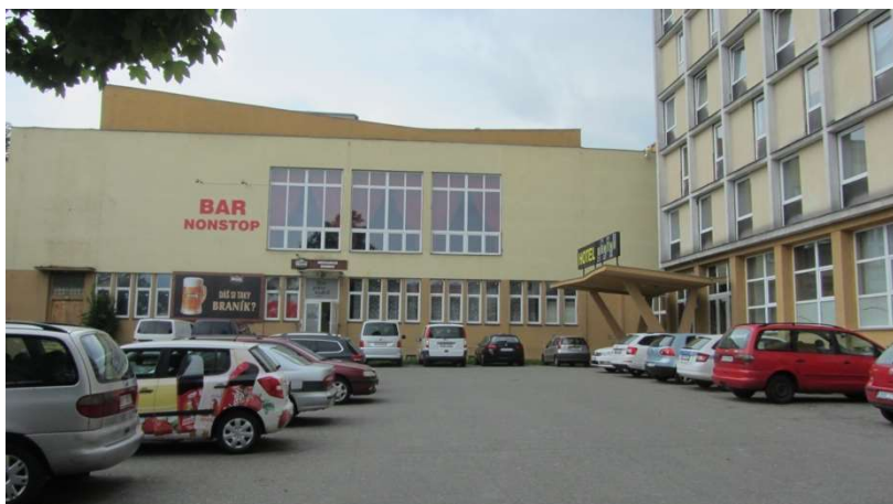
Obrázek 20 Ubytovna Domino

Okolí ubytovny a restaurace Domino je konzistentně vnímáno negativně jako místo, kterému je dobré se vyhnout. Až do změn na jaře 2019, které souvisely s novým majitelem a orientací na ubytování zahraničních dělníků, na ubytovně žily především osoby s nízkými příjmy (např. starobní a invalidní důchodci). Obyvatelé okolních domů Domino považují za ošklivé a nebezpečné (do restaurace Domino chodí výjimečně) a obyvatelé ubytovny s nimi v zásadě souhlasí. K jejich nespokojenosti dále přispívají životní podmínky na ubytovně (např. štěnice). K všeobecnému sníženému pocitu bezpečí přispívá také prostor za ubytovnou, kde se ve zvýšené míře pohybují uživatelé drog („ tam slušný člověk nejde “ 28 ).