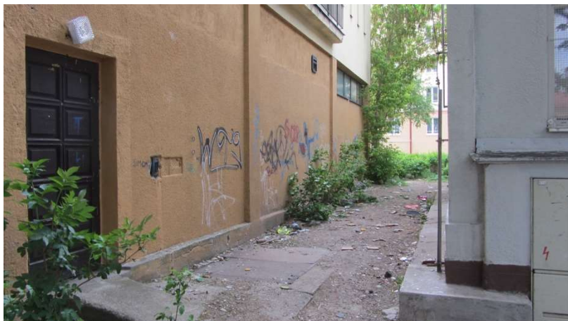
Obrázek 9 Prostor mezi hospodou Domino a trafostanicí