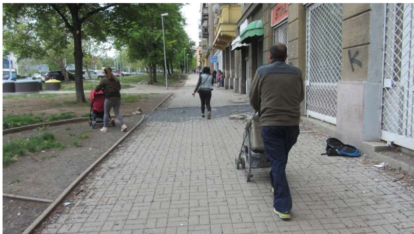
Obrázek 7 Život na Tř. Budovatelů