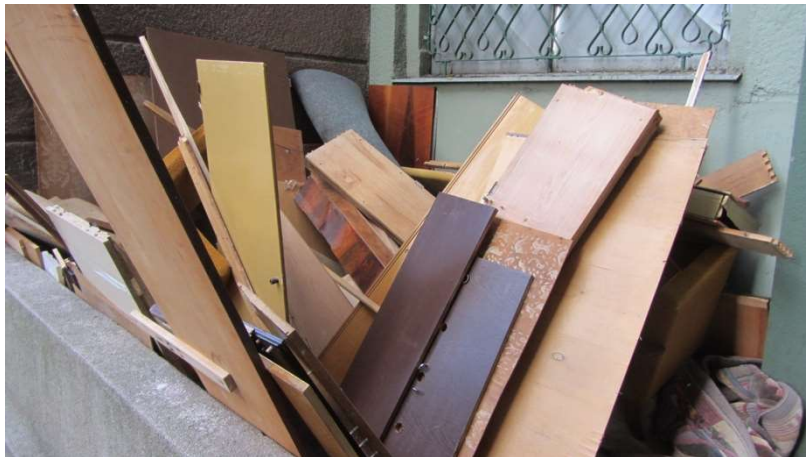
Obrázek 4 Vyhozený nábytek na dvoře u bloku 92