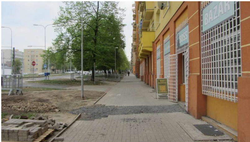
Obrázek 2 Tř. Budovatelů