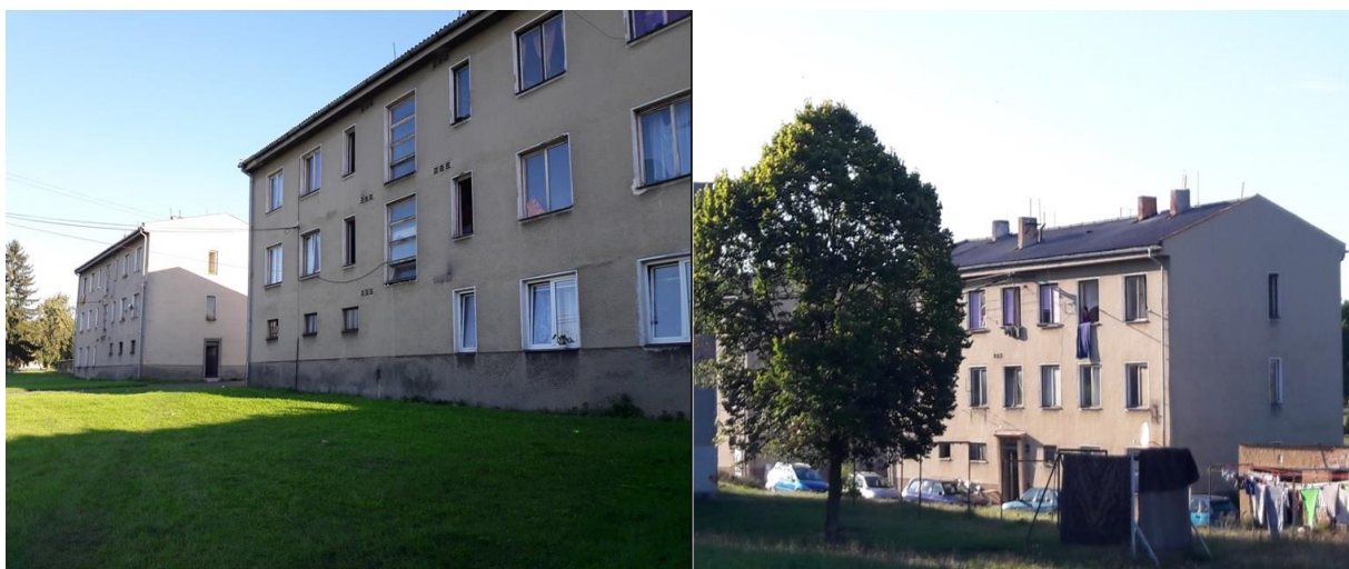
Foto č. 1 a 2: Bytové domy č. p. 43 a 44 v Semněvicích.

Semněvice jsou obcí v okrese Domažlice v Plzeňském kraji s celkem 232 obyvateli. 4 Dle analýzy sociálně vyloučených lokalit z roku 2015 5 je v obci přítomna jedna SVL se 40 obyvateli (což v roce 2015 činilo více, jak 21 % obyvatel obce). V žádosti obce o poskytnutí Vzdálené dílčí podpory z července 2019, jsou jako SVL označeny panelové domy č. p. 43, 44 a také dům č. p. 23. Podle rozhovorů provedených v září 2019 byly jako tzv. „horší adresy“, či SVL označovány oba zmíněné bytové domy (43 a 44) a také dům č. p. 45. Všechna tři čísla popisná jsou bytovými domy v soukromém vlastnictví tří různých majitelů, přičemž majitel domu č. p. 43 funguje zároveň jako správce domu č. p. 44. Mezi obyvateli všech bytových domů převažují Romové.