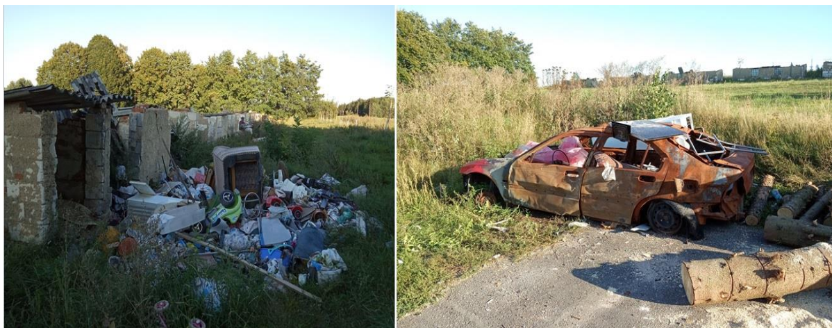
Foto č. 3 a 4: Nepořádek v okolí bytových domů a vypálený autovrak v Semněvicích