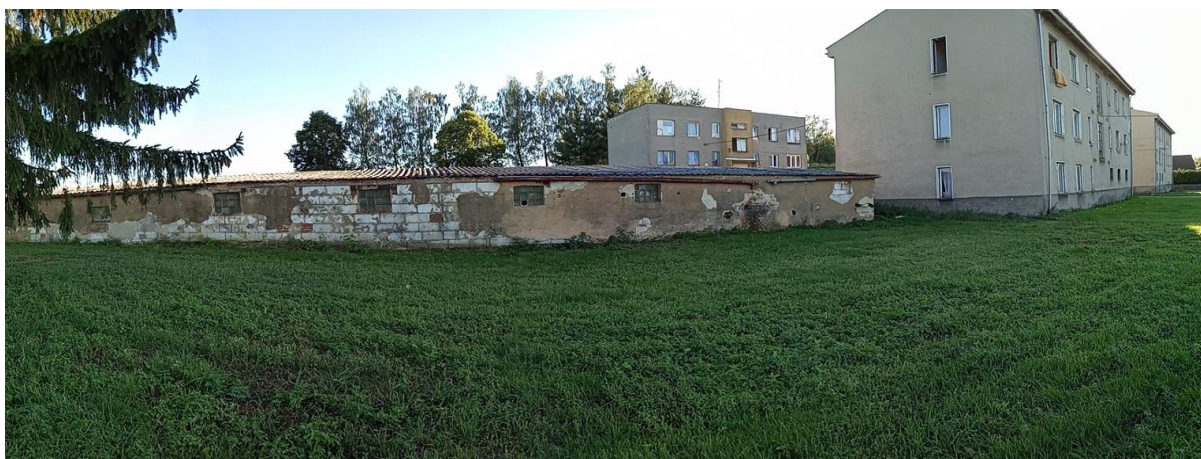
Foto č. 5: Bývalé chlívký u bytových domů v Semněvicích

Občanské soužití v Semněvicích je ve srovnání s okolními obcemi ovlivněno situací v bytovkách, což potvrzují dotazovaní příslušníci bezpečnostních složek: