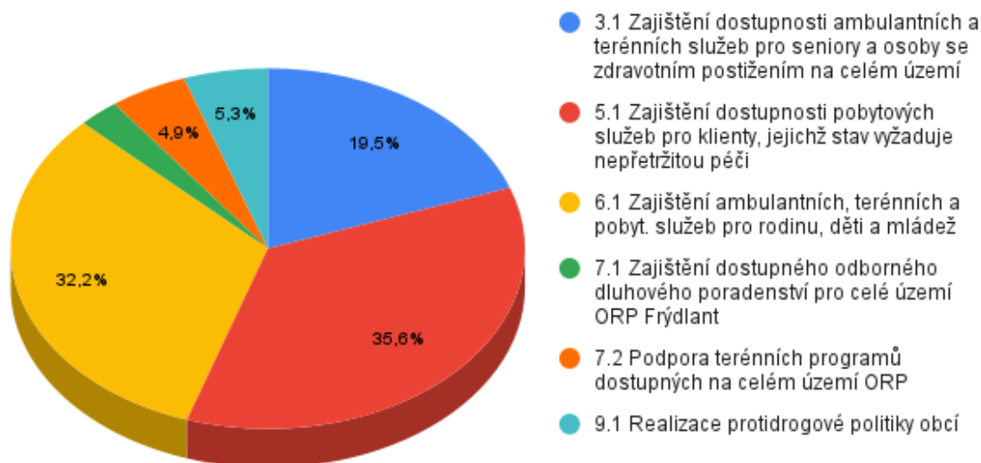
Obrázek 3: Rozdělení měšce v roce 2021