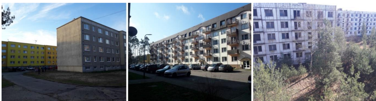
Foto č. 1: Sídlíště v Ploužnici, domy v majetku měst Ralsko, Mimoň a tzv. urbexy

Jedná se o panelové sídliště v bývalém vojenském prostoru vybudované sovětskou armádou. V lokalitě jsou obývány 4 panelové domy ve vlastnictví města Mimoň, 2 panelové domy ve vlastnictví města Ralsko a dalších 8 chátrajících neobydlených domů (tzv. urbexy) v majetku soukromých vlastníků. Obyvateli Ploužnice jsou z velké části Romové (někteří) původem z centra nedaleké Mimoně, kteří se sem přistěhovali zejména kvůli nižším cenám za nájemné. Žijí zde však i někteří cizinci, zejména Ukrajinci, či Mongolové. Někteří z těchto obyvatel využili nabídky levnějšího bydlení z důvodu finančních potíží, exekucí a insolvencí. Nižší nájemné je atraktivní např. i pro seniory z okolních obcí.