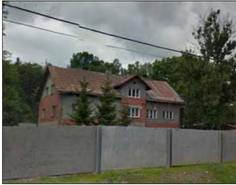
Fotografie č. 4: Za Betonárou

Dům č. p. 365 (Za Betonárou) leží u hlavního tahu směrem na Plavy poblíž vlakového nádraží, od náměstí je vzdálený 600 metrů. Bydlí zde osm domácností, čtyři romské, dvě smíšené a dvě majoritní. Celkově jde o 23 lidí, většina zde bydlí již delší čas. Obyvatelé jsou oficiálně ekonomicky neaktivní, závislí na sociálních dávkách. Současný majitel (bydlí nedaleko) s nájemníky komunikuje, do celkových oprav i do vybavení jednotlivých bytů investuje. Nájemné je na úrovni