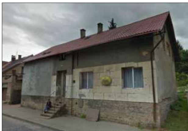
Fotografie č. 3: Naproti hasičárně

V červenci 2013 vyšlo najevo, že na dům je uvalena exekuce. Majitelka tak neměla právo se současnými obyvateli uzavřít nájemní smlouvu a ta je tím pádem neplatná. Nájemníkům proto nevzniklo právo na vyplacení příspěvku na bydlení, který by dorovnal jejich výdaje, a rodiny se tak ocitly ve velmi složité finanční situaci. V době výzkumu se majitelka zdržovala v cizině a s nájemníky nekomunikovala. Rodiny zaplatily nájem za červen a červenec, srpnový nájem byl zadržen na obecním úřadě, nájem za září nájemníci nezaplatili vůbec. S řešením situace se čekalo na návrat majitelky.