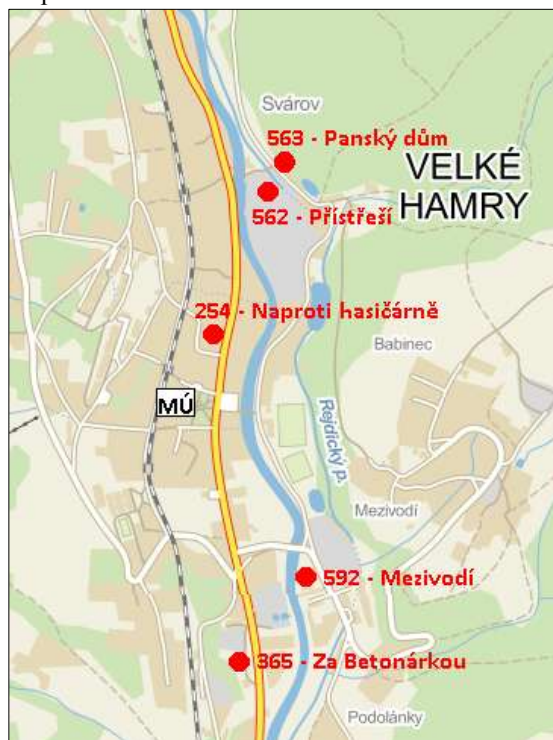
Mapa č. 3: Rozmístění SVL v obci

Jde o domy vlastněné soukromými majiteli. Dva domy (č. p. 592 – Mezivodí, 563, 564 – Panský dům) původně vlastnilo město a v devadesátých letech je privatizovalo, další dům (365 – Za Betonárkou) byl vrácen v restituci a poslední je dlouhodobě v soukromém vlastnictví, majitelé se ale měnili (254 – Naproti hasičárně).