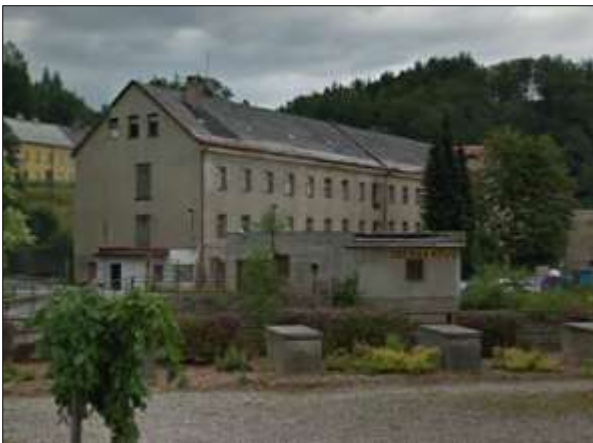
Fotografie č. 5: Přístřeší

Objekt č. p. 562 – (přístřeší) se nachází v blízkém sousedství Panského domu. Je to část bývalého internátu v industriálním objektu ve vlastnictví obce. Jde o přechodnou formu ubytování. Doba využívání je městem stanovena na tři měsíce s možností prodloužení na šest měsíců (v době výzkumu současní obyvatelé chtěli vyjednat o prodloužení až na maximální dobu jednoho roku). Přístřeší bylo ve městě zřízeno jako nouzové řešení situace při vystěhovávání objektu “Kartouz”, ve kterých v