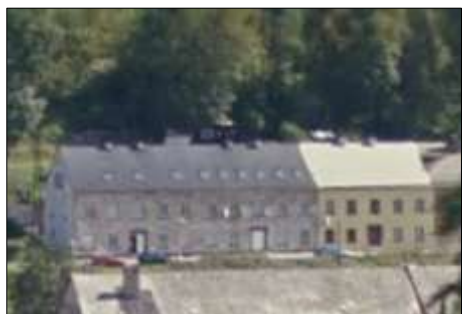
Fotografie č. 2: Panský dům

Jde hlavně o dům č. p. 563, 564 (Panský dům) , kam se na přelomu května a června roku 2013 přestěhovaly tři rodiny z Mezivodí, celkem 17 obyvatel. Dva lidé zde v době výzkumu pravděpodobně přebývali bez smlouvy.