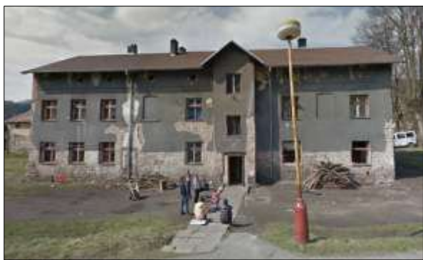
Fotografie č. 1: Mezivodí 5

Většinu znaků SVL nese objekt č. p. 592 (Mezivodí). Vlastníkem je soukromá osoba, která do domu dlouhodobě neinvestuje, jako hlavní důvod uvádí dluhy na nájemném. Dům je celkově ve velmi špatném technickém stavu, a to jak společné prostory, tak i jednotlivé bytové jednotky. Chybí okna, je problém s odpadní jímkou a vodou. Nájemné je s přihlédnutím ke stavu objektu nepřiměřeně vysoké – 7 až 7,5 tisíce korun za samotný nájem. Další 2 tisíce pak platí nájemníci za elektřinu. Objevují se zde opakovaně dluhy na nájemném, které v době výzkumu řešil majitel s nájemníky splátkovým kalendářem, vyjednaným prostřednictvím NNO Most k naději. Majitel s nájemníky prakticky nekomunikuje, vše řeší pověřený správce. V polovině roku 2013 správce vybral domovníka, který vykonáváním funkce splácí dlužné nájemné.