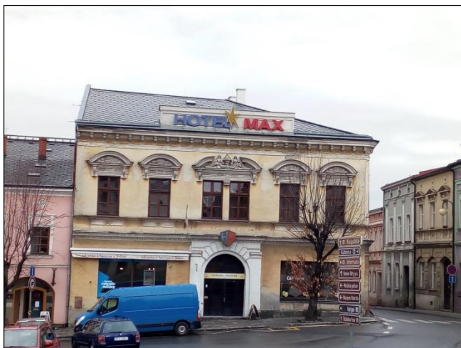
Obrázek 9 - Ubytovna AC Aero (Potoční 525/37) – soukromý vlastník