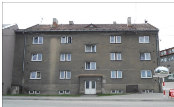
Obrázek 3 - Okružní 75/22 – 7 bytových jednotek; vlastník Město Odry