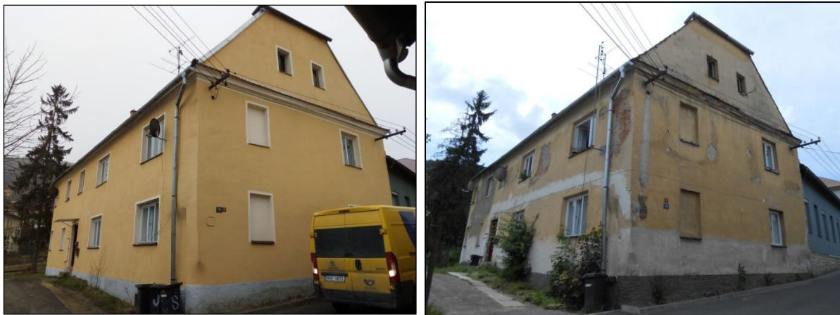
Obrázek 5 - Slunečná 172/1 – 6 bytových jednotek; soukromý vlastník