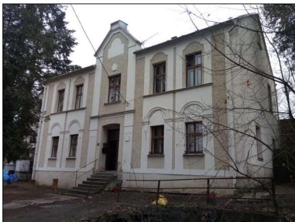
Obrázek 1 - 1.Máje 383/41 – 4 bytové jednotky; vlastník Město Odry

Následuje výčet lokalit ve srovnání aktuálního stavu s rokem 2013 7 :