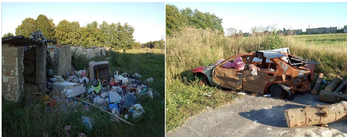
Foto č. 3 a 4: Nepořádek v okolí bytových domů a vypálený autovrak v Semněvicích