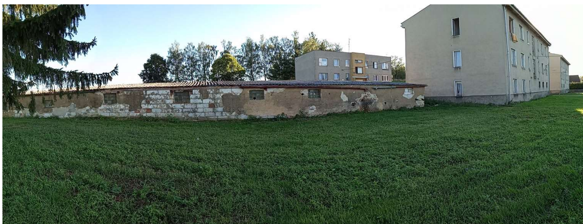
Foto č. 5: Bývalé chlívký u bytových domů v Semněvicích

Občanské soužití v Semněvicích je ve srovnání s okolními obcemi ovlivněno situací v bytovkách, což potvrzují dotazovaní příslušníci bezpečnostních složek: