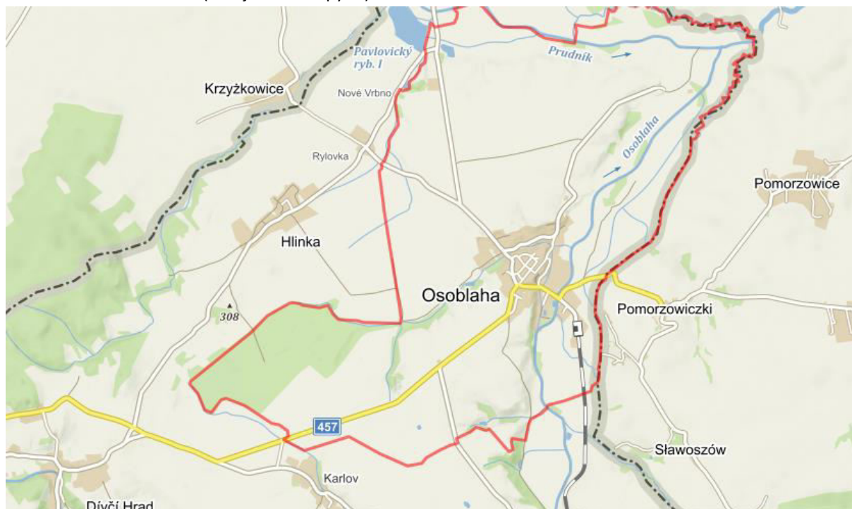
Obr. č. 1: Obec Osoblaha

Co se týče sociálního vyloučení, ohroženi jsou nejvíce nezaměstnaní, v roce 2015 se jednalo o 132 osob, z nichž 70 bylo v evidenci Úřadu práce déle než 12 měsíců. V poslední době se mluví o přísunu sociálně slabých z Krnova a Města Albrechtice, protože je tady v panelácích levnější bydlení. Toto nám ale ředitel školy vyvrátil s tím, že se nejedná o nijak masivní stěhování. Tomu nasvědčují i statistické údaje, kdy v roce 2015 byl přirozený přírůstek obyvatelstva -17 a co se týče rozdílu mezi přistěhovanými a odstěhovanými se jednalo v obou případech o 86 osob. Vlna přistěhování sociálně slabých přišla po privatizaci panelových bytů umístěných v centru obce, téměř na náměstí. Nájem v těchto bytech jsou až trojnásobně vyšší než je obvyklé v obecních bytech, ty ale jsou pro lidi mimo Osoblahu obtížně dostupné a momentálně jsou z velké části obsazené. V panelových bytech bydlí podle odhadů v současnosti přibližně 200 Romů a podle SPSZ byl největším problémem soužití majority a minority jiný pohled na užívání veřejného prostranství.