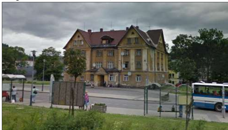
Fotografie č. 5: Dům v Tanvaldu (U Autobusáku)

Dům U Autobusáku vlastněný pražskou společností RIAL spol. s.r.o. je nepřehlédnutelnou SVL prakticky v centru Tanvaldu. Dům je ve špatném technickém stavu a obvykle před ním postávají hloučky Romů – jediných obyvatel domu (dříve tu bydleli i starší neromští nájemníci, nikdo z nich už ale nežije). Počet rodin ani lidí