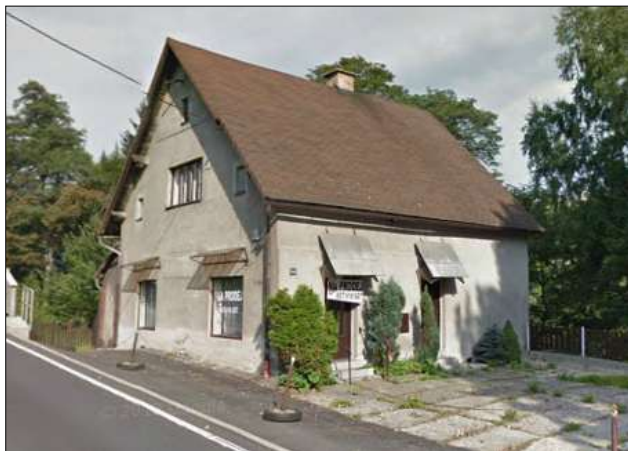
Fotografie č. 4: Dům na Smržovce (Naproti Centru)

Další dům u hlavní silnice mezi Tanvaldem a Smržovkou vlastní paní Lavičková z Velkých Hamrů. „U Centra“ se mu říká, neboť naproti se nachází nízkoprahové zařízení pro děti a mládež. Než jsme se do domu vypravili, provedli jsme rozhovor právě s majitelem. Dozvěděli jsme se, že všichni nájemníci bydleli dříve ve Velkých Hamrech, majitel se s nimi znal a nabídl jim bydlení. V uplynulých měsících se podařilo zrekonstruovat 5 ze 6 bytových jednotek, obydlené byly v době výzkumu 4 (u 5. se