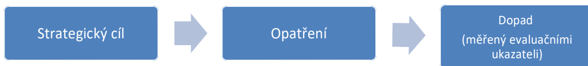
Schéma 1 Postup při stanovování dopadů intervencí

V úvodní fázi evaluace lokality je vytvářen evaluační design, do něhož jsou zaneseny strategické a obecné cíle ze SPSZ, opatření, kterými jsou dosahovány, jejich výstupy a očekávané dopady spolu s evaluačními ukazateli. Realizované a nerealizované výstupy jsou zjišťovány za pomoci lokálního konzultanta či místních aktérů a dopady jsou definovány s ohledem na specifický kontext lokální situace. V případě některých intervencí – typicky u posilování kapacit sociálních služeb – zůstáváme při formulování dopadů spíše na úrovni výstupů, neboť zjišťování dopadů by vyžadovalo využití výrazně robustnějších výzkumných metod, než umožňuje evaluační proces v ASZ.