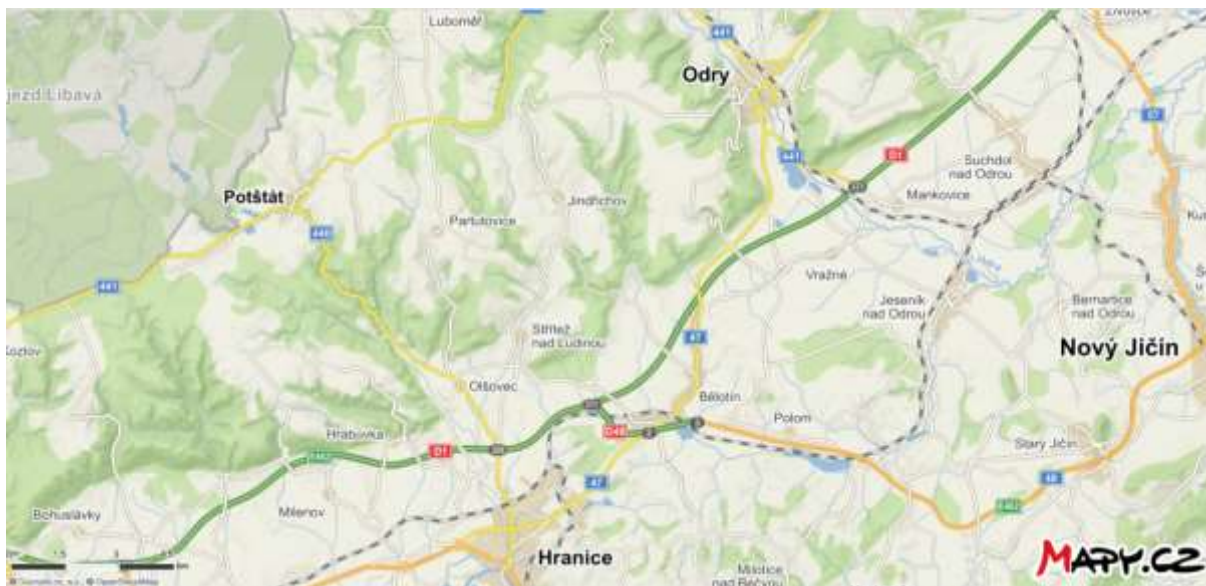
Mapa 1 – Mikroregion Rozvodí a širší okolí

Mikroregion Rozvodí se nachází v jihovýchodní části Olomouckého kraje, přibližně 30 km východně od krajského města Olomouce a v bezprostřední blízkosti města Hranice. Jeho součástí je 7 obcí: Bělotín (1830 obyvatel), Polom (269 o.), Potštát (1167 o.), Jindřichov (457 o.), Olšovec (477 o.), Střítež nad Ludinou (817 o.) a Partutovice (496 o.), které mají dohromady 5513 obyvatel (cca 16 % z ORP). Obce administrativně spadají pod ORP Hranice, které zahrnuje 32 obcí s celkovými 34 296 obyvateli 2 . Polom a Bělotín leží na páteřní železniční trati spojující Olomouc, Přerov a Ostravu a na důležité vnitrostátní silnici E 462 (resp. D 48), která tvoří spojnici mezi Českým Těšínem a Olomoucí. Část mikroregionu také protíná úsek dálnice D 1 mezi Ostravou a Olomoucí. Území mikroregionu netvoří žádný přirozený ani souvislý geografický, administrativní či politický útvar. Jedná se o účelové spojení několika obcí za účelem lepšího prosazování společných zájmů. Obce sdružené v MR Rozvodí zároveň patří do Mikroregionu Hranicko i Místní akční skupiny (MAS) Hranicko.