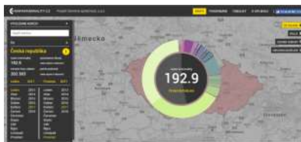
Mapa 2 – Srovnání indexu kriminality v OO Hranice, Olomouckém kraji a v celé ČR

Ke statistickým údajům za jednotlivé obce se objevují pouze některé vybrané údaje v přihlášce ke spolupráci s ASZ, například obec Polom uvádí, že za rok 2017 došlo v 5–6 případech k narušení veřejného soužití, obec Olšovec potom, že dle PČR bylo hlášeno 4 drobné krádeže. Nejvíce tak problematiku pocítují v Běltošíně (bez doložených statistických údajů), kde dle tvrzení z přihlášky dochází opakovaně k případům drobných krádeží, vloupání do aut nebo vandalismu, přičemž situace je dáována do souvislosti se snadnou dopravní dostupností z hlavního silničního i železničního uzlu. S dopravní dostupností souvisí také pravděpodobně snadnější distribuce drog, kterou považuje za problematickou většina starostů dotčených obcí, kdy dle jejich sdělení se to týká především marihuany a pervitinu, ale i dalších. Starostové také uváděli případné pašování lékařských surovin z Polska. Z hlediska prodeje drog jsou jako riziková místa uváděny obslužné silnice u dálnice. V Potštátě přímo zmiňovali pěstírnu marihuany v místní části Boškov, kterou však v minulém roce odhalila Policie ČR.