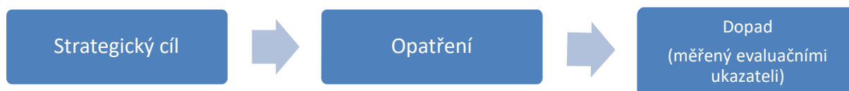
Schéma 2: Postup při stanovování dopadů intervencí

V úvodní fázi evaluace lokality je vytvářen evaluační design, do něhož jsou zaneseny strategické a obecné cíle ze SPSZ, opatření, kterými jsou dosahovány, jejich výstupy a očekávané dopady spolu s evaluačními ukazateli. Realizované a nerealizované výstupy jsou zjišťovány za pomoci lokálního konzultanta či místních aktérů a dopady jsou definovány s ohledem na specifický kontext lokální situace. V případě některých intervencí – typicky u posilování kapacit sociálních služeb – zůstáváme při formulování dopadů spíše na úrovni výstupů, neboť zjišťování dopadů by vyžadovalo využití výrazně robustnějších výzkumných metod, než umožňuje evaluační proces v ASZ.