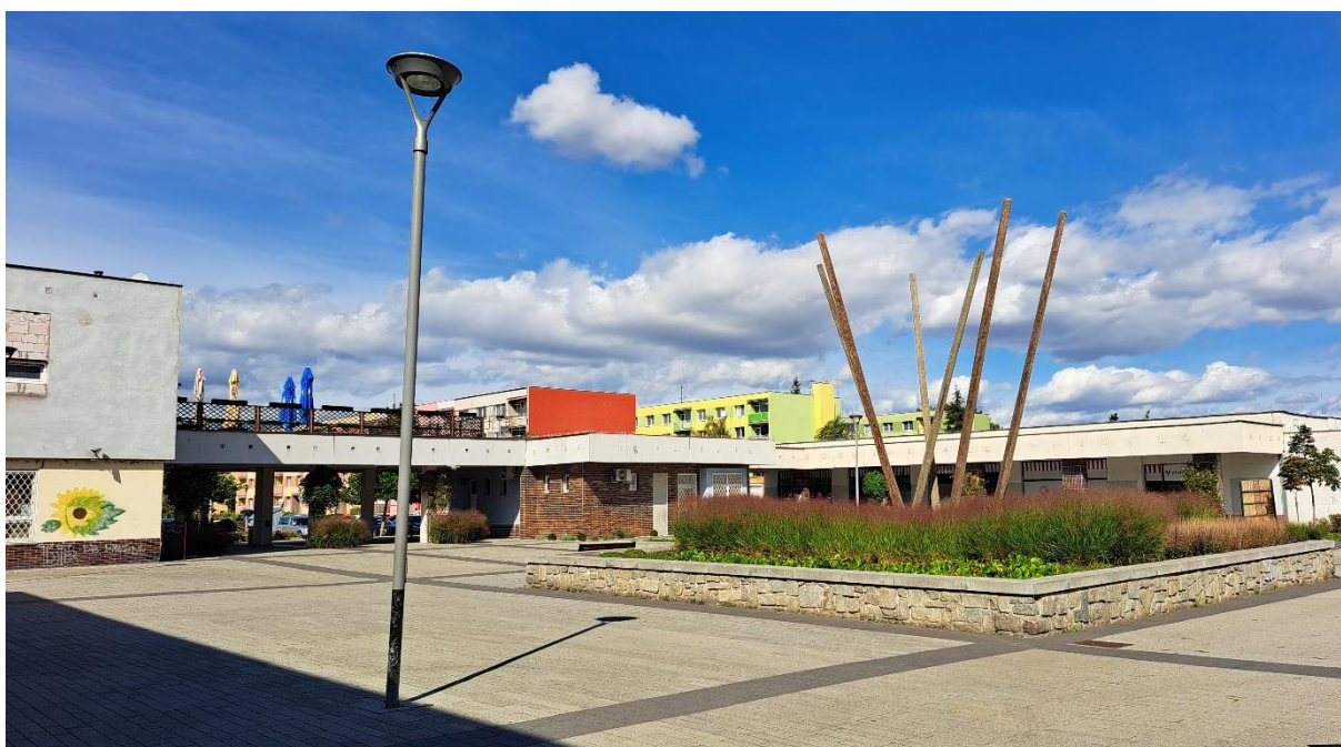
Obrázek 5 Náměstí Poperinge