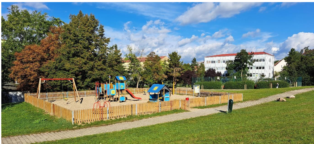
Obrázek 2 Rákosníčkovovo hřiště v Podměstí