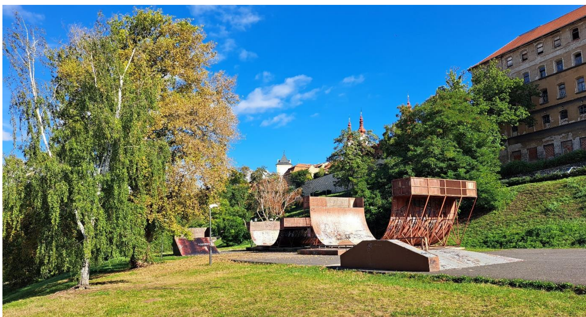
Obrázek 3 Skatepark