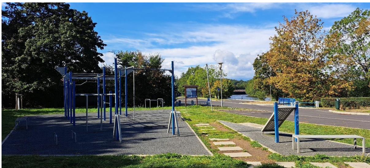
Obrázek 4 Workoutové hřiště