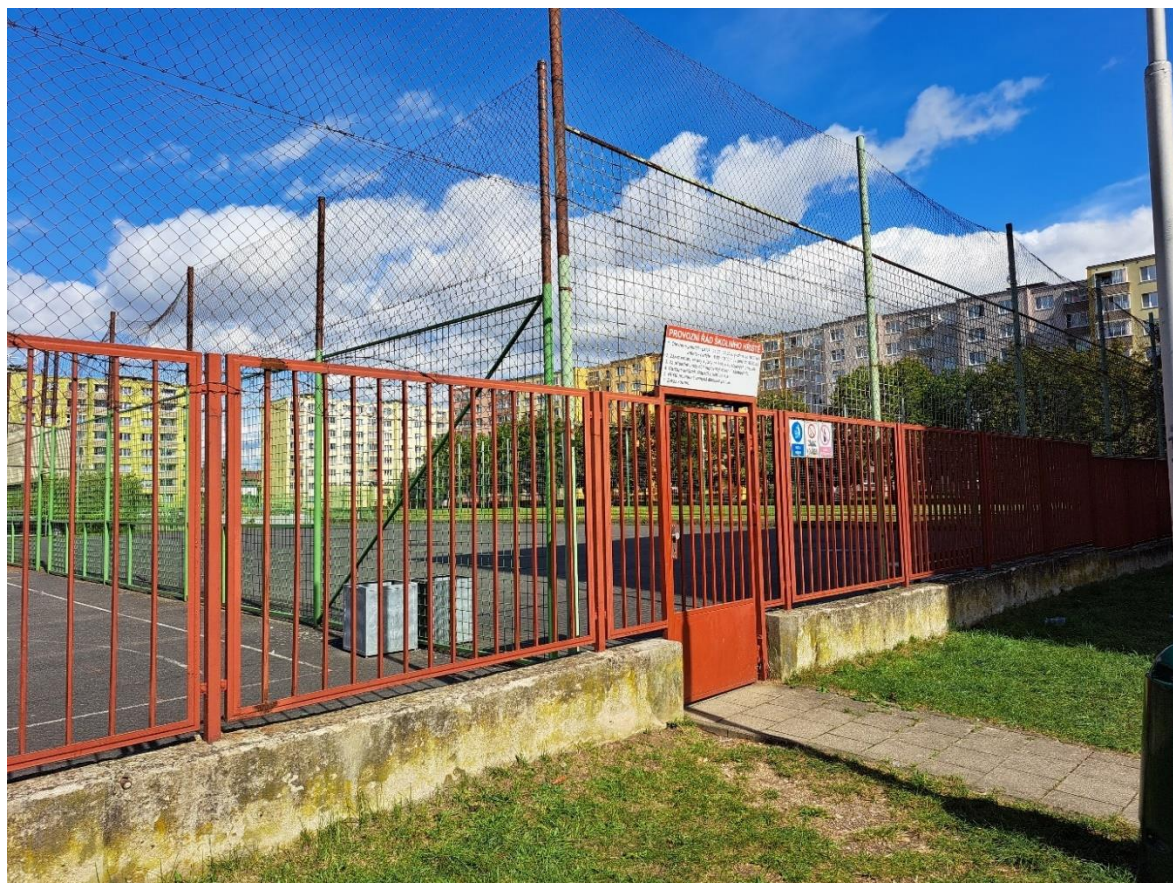
Obrázek 1 Školní hřiště za ZŠ Žatec, Jižní

Za místa pro ně nepříjemná nebo vnímaná jako nebezpečná označily např. park za nemocnicí, který „je plný stříkaček“, okolí Tesca, „Účko u Penny je divné“, „Kulaťák je nebezpečný“, na Kruhovém náměstí jim vadily osoby pod vlivem alkoholu, další zmínil i prostranství u KD Moskva kvůli „feťákům“. Děti komentovaly, že se jim nelíbí graffiti nebo posprejované zdi.